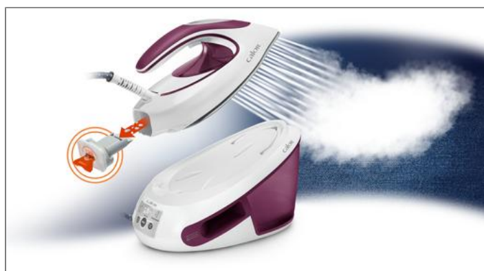
EXPRESS ANTI-CALC 6,5 BARS BLANC ET VIOLET Centrale vapeur SV8054CO