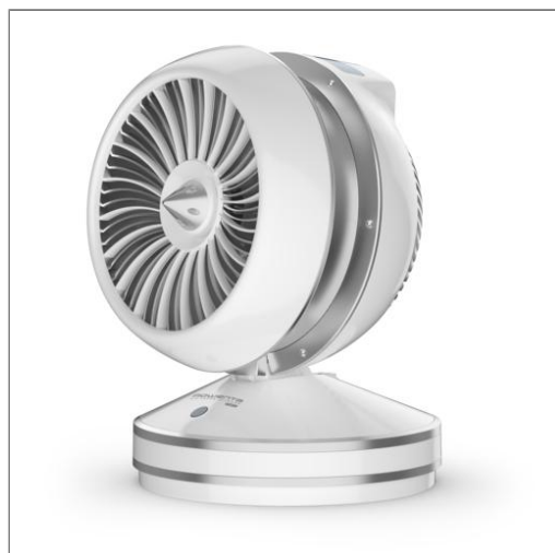
AIR FORCE INTENSE 2EN1