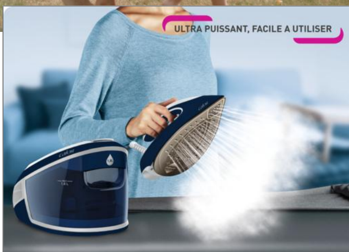
EXPRESS POWER 6,6 BARS BLEU METAL ET BLANC Centrale Vapeur SV8060C0