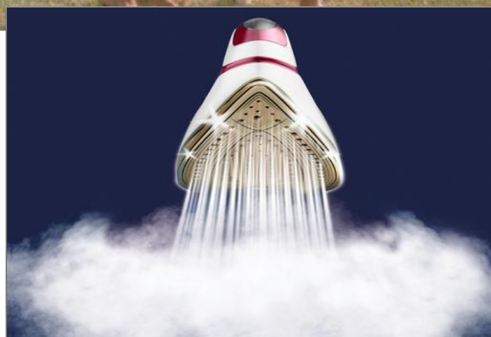
PRO EXPRESS PROTECT 7,5 BARS ROUGE CENTRALE VAPEUR GV9220C0