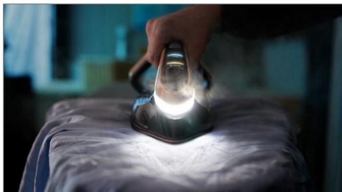
PRO EXPRESS VISION 3000 W Noir et doré CENTRALE VAPEUR GV9820CO