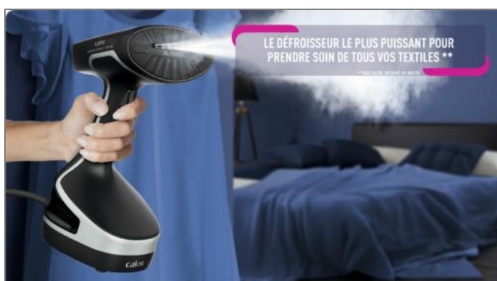
ACCESS STEAM FORCE DT8270C0