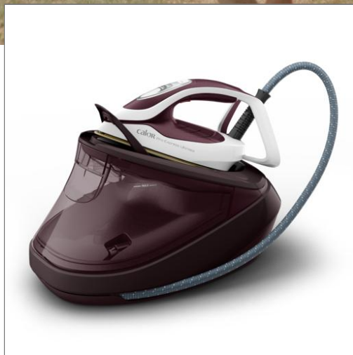
PRO EXPRESS ULTIMATE II CENTRALE VAPEUR GV9721C0