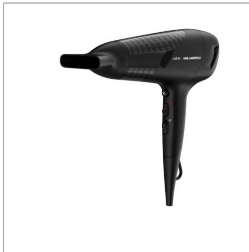
STUDIO DRY Sèche-cheveux moteur DC CV581LC0