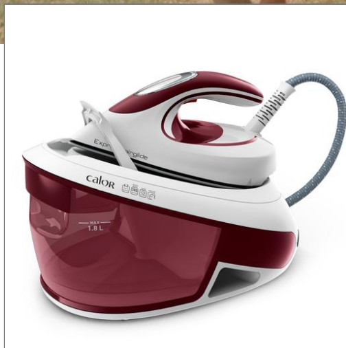
EXPRESS AIRGLIDE 6,2 Bars Blanche et Bordeaux Centrale Vapeur SV8026C0