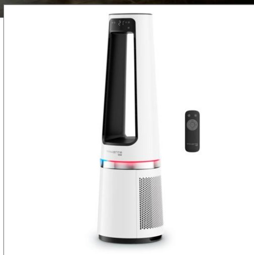
Eclipse 3-en-1 Blanc Purificateur 3-en-1 QU5060F0