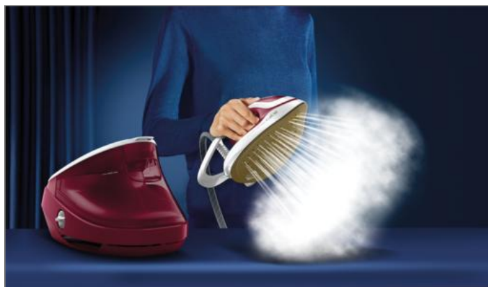
Pro Express Ultimate, Pression 8 bars, Débit vapeur 170 g/min CENTRALE VAPEUR GV9723C0