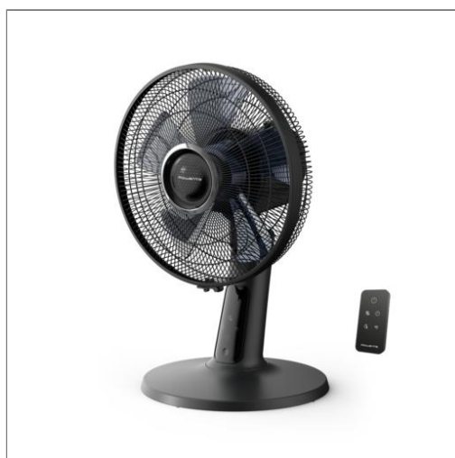
Turbo Silence Extreme+, Ventilateur de table, Rafraîchissement intense, Silencieux Ventilateur de table VU2750F0