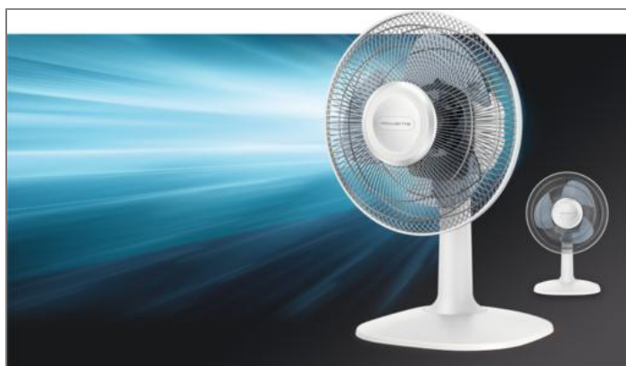
ESSENTIAL+ VENTILATEUR DE TABLE VU2310F0