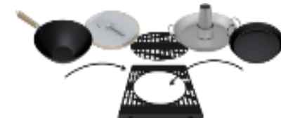
Multi-cuisson : Culinary Modular®