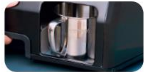
Récupérateur de graisse latéral Capacité: de la tasse : 45 cl

Réf : 3000006028 PCB : 3 – Gencod : 3 13852 211439 8