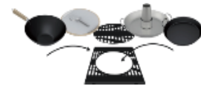
Multi-cuisson : Culinary Modular®