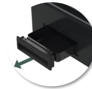
Récupérateur de graisses latéral intégré au châssis, d'une capacité de 52 cl.