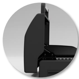
Couvercle de cuisson avec thermomètre intégré.