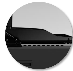
Plancha à rebords surélevés pour une meilleure protection contre les projections et une manipulation des aliments facilitée.