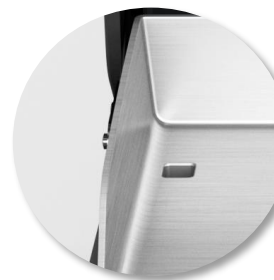
Evacuation des graisses par l'arrière, évitant ainsi les projections vers l'avant lors de l'utilisation