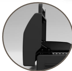
Couvercle de cuisson avec thermomètre intégré.