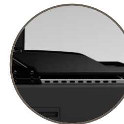
Plancha à rebords surélevés pour une meilleure protection contre les projections et une manipulation des aliments facilitée.

Montée en température deux fois plus rapide**