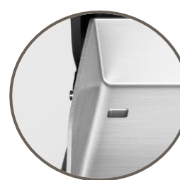
Evacuation des graisses par l'arrière, évitant ainsi les projections vers l'avant lors de l'utilisation