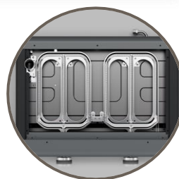
6 rampes de brûleurs dotés de la technologie Blue Flame