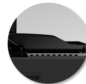
Plancha à rebords surélevés pour une meilleur protection contre les projections et une manipulation des aliments facilitée.