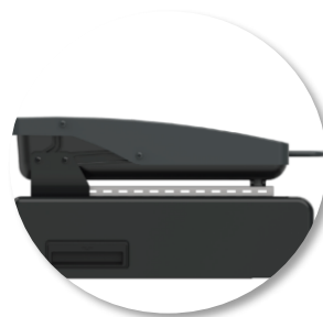
Couvercle de protection sur charnières