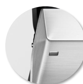
Evacuation des graisses par l'arrière, évitant ainsi les projections vers l'avant lors de l'utilisation