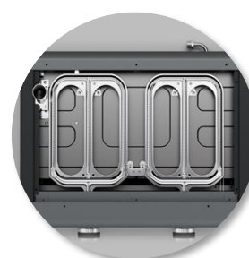
6 rampes de brûleurs dotés de la technologie Blue Flame