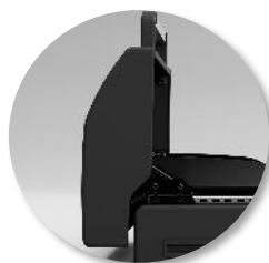
Couvercle de cuisson avec thermomètre intégré.