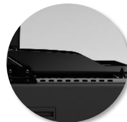
Plancha à rebords surélevés pour une meilleure protection contre les projections et une manipulation des aliments facilitée.