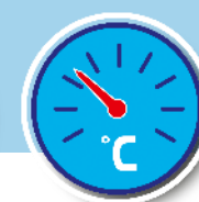
Couvercle de cuisson avec thermomètre

Technologie Blue Flame : brûleurs haute performance brevetés, pour une parfaite répartition de la chaleur sur toute la surface de cuisson