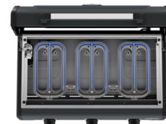
9 rampes de brûleurs dotés de la technologie Blue Flame