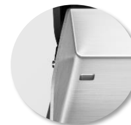
Evacuation des graisses par l'arrière, évitant ainsi les projections vers l'avant lors de l'utilisation