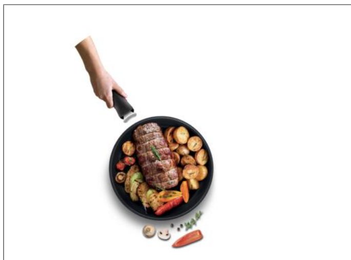
Ingenio Poignée amovible Premium noire Poignée amovible L9863202