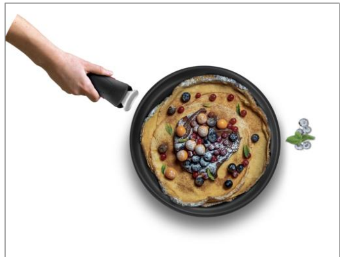
Eco Resist Poêle à crêpe 27 cm Poêle à crêpe 27 cm L8581004