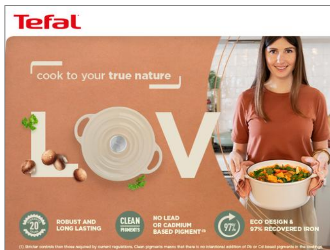
LOV Faitout 29 cm Beige Faitout 29 cm E2590504