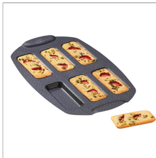
PerfectBake Mini 6 financiers Moule mini 21 x 29 cm J5734402