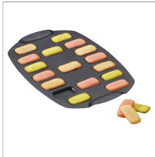
PerfectBake Mini 17 mini-financiers Moule mini 21 x 29 cm J5734702