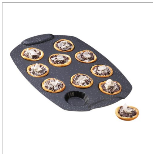
PerfectBake Mini Moule tartelettes Moule mini 21 x 29 cm J5735002