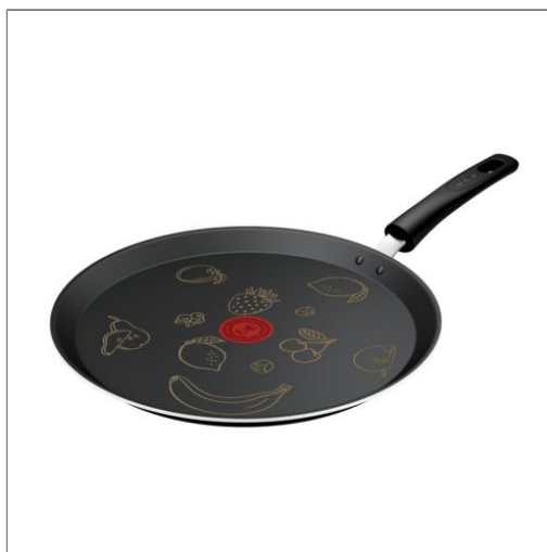
Galettère Chandeleur 2025 32 cm Induction GALETTIÈRE - 32 CM E5241602