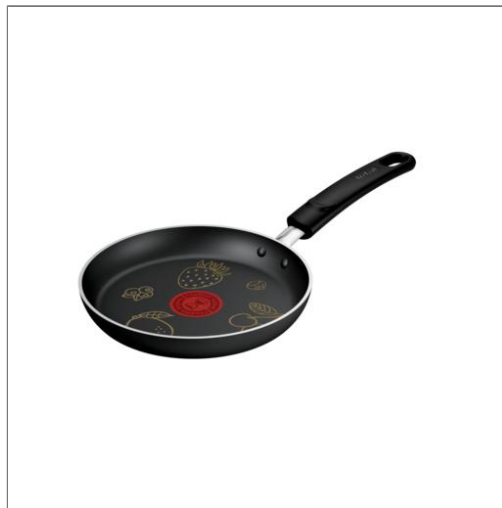
Poêle à blinis Chandeleur 2025 19 cm Induction POÊLE - 19 CM E5240102