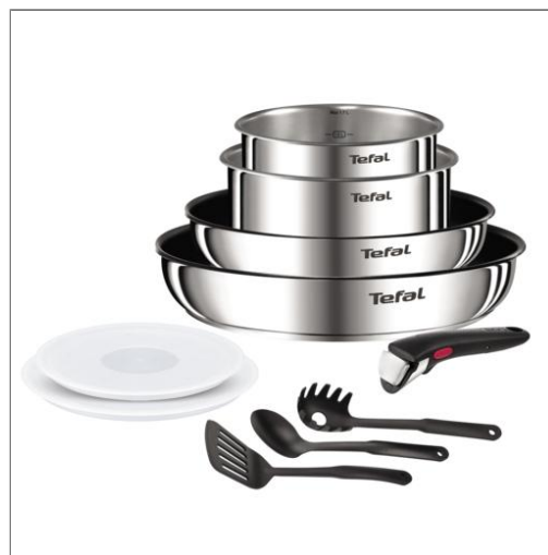
Ingenio Emotion Batterie de cuisine 10 pièces, Acier inoxydable, Induction L8979104