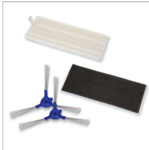
Filtre Allergy, filtre mousse et brochettes ZR720002 ZR720002