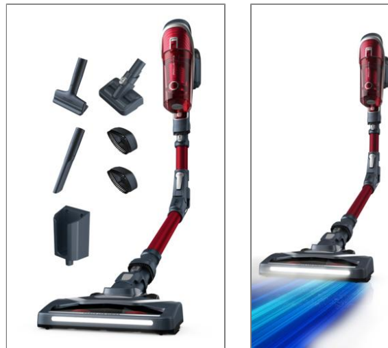
X-FORCE FLEX 8.60 ANIMAL KIT Aspirateur balai sans fil multifonction RH9679WO