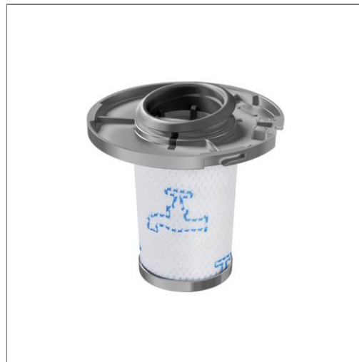
Filtre séparateur ZR009006 ZR009006