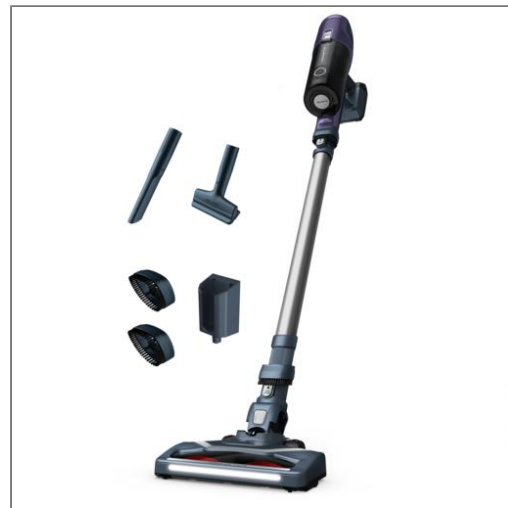
X-PERT 6.60 Essential Aspirateur balai multifonction RH6837WO