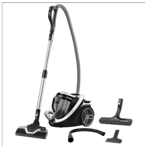
Silence Force Cyclonic Aspirateur sans sac R07640EA