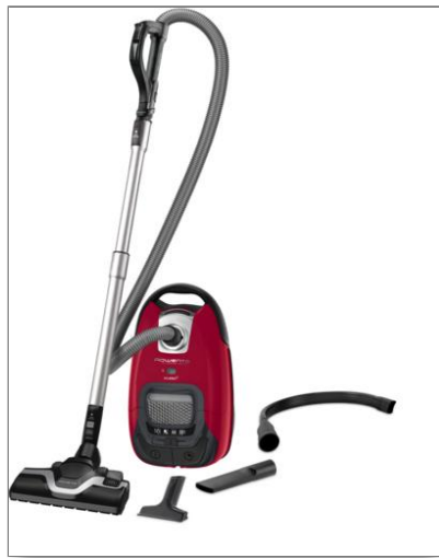
Silence Force Effitech® Aspirateur avec sac R07453EA