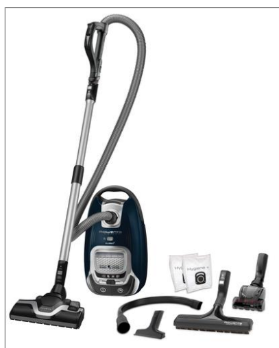
Silence Force Effitech® Aspirateur avec sac R07471EA