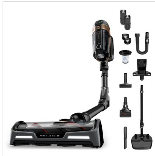
X-Force Flex 15.60, Aspirateur balai sans fil, 245 AW, 2h40, 2 batteries RH99F3WO Aspirateur balai sans fil multifonction RH99F3WO