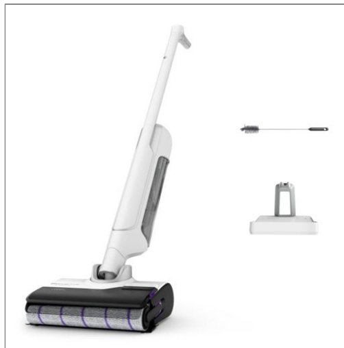
X-Clean 10 Aspirateur laveur sans fil, Longue autonomie, Nettoyage et séchage automatique Aspirateur laveur sans fil GZ7035W0