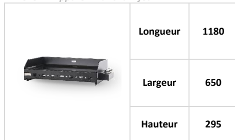
Annexe 1 : Appareil Plancha 4 feux