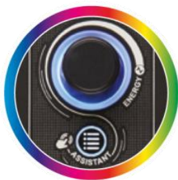
IMA INTELLIGENT MUSIC ASSISTANT