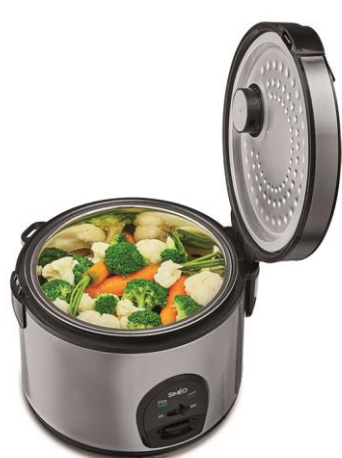
Panier vapeur inox

Cuisson et maintien au chaud automatique