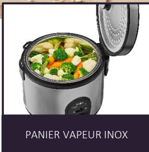
PANIER VAPEUR INOX