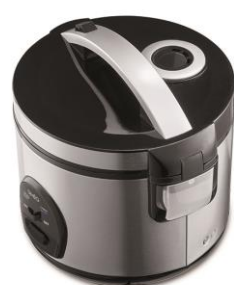
Valve vapeur Récipient collecteur