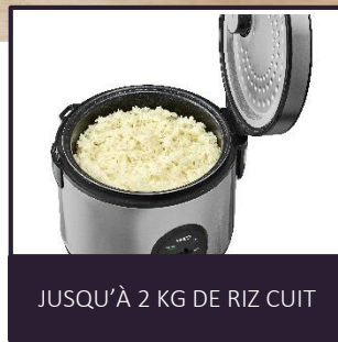
JUSQU'À 2 KG DE RIZ CUIT