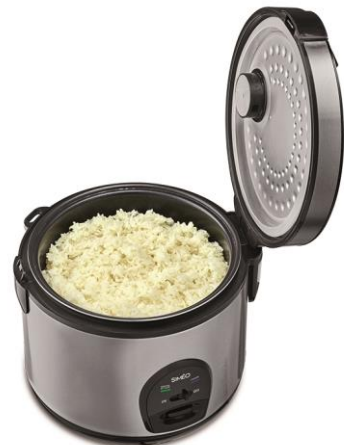
Jusqu'à 16 portions de riz cuit