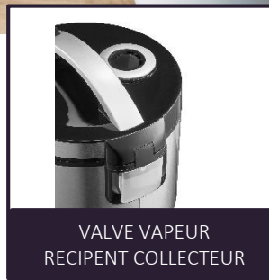
VALVE VAPEUR RECIPENT COLLECTEUR