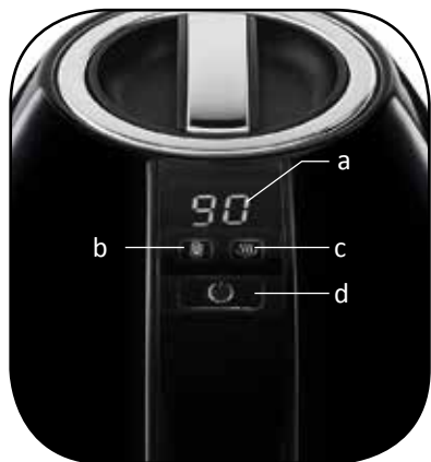
Écran LCD et panneau de commande (3.)