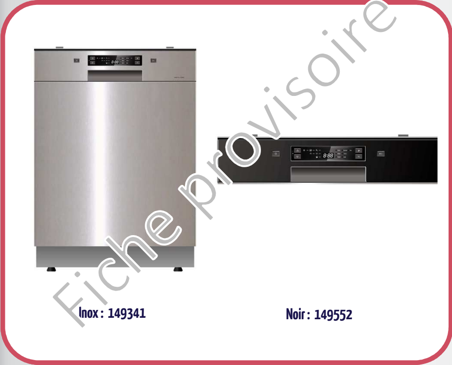
Inox : 149341