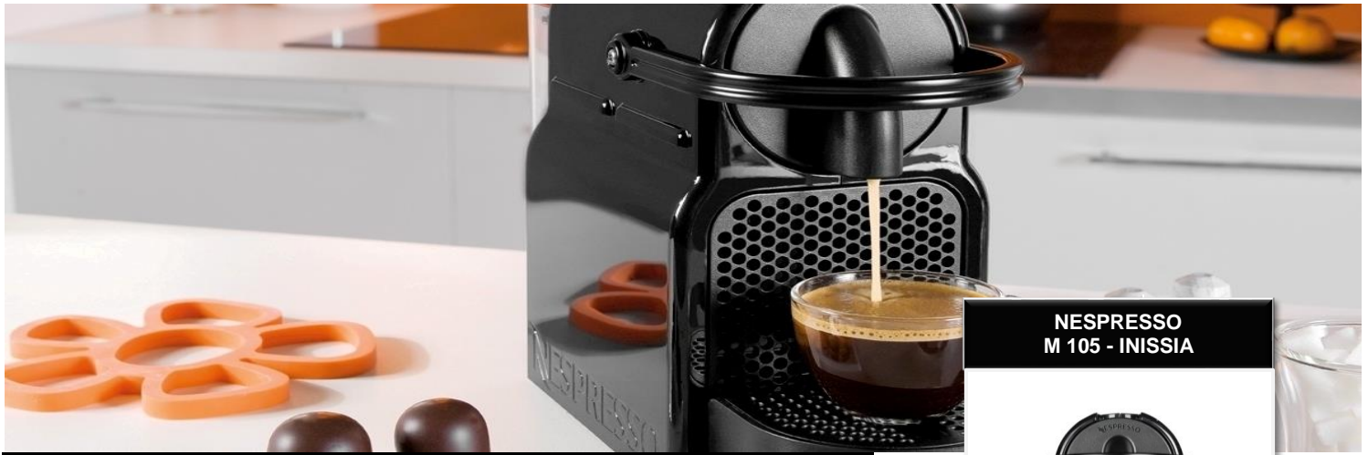
NESPRESSO M 105 - INISSIA