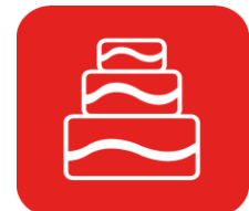
PATISSIER XL jusqu'à 16 parts

Bol double paroi pour un maintien au chaud pendant 2 heures, il vous permet de préparer vos recettes à l'avance.