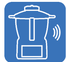
CONNECT Cook Expert & balance connectés