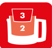
BOLS 3 EN 1