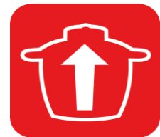
BOL XL 4,8 L jusqu'à 16 personnes