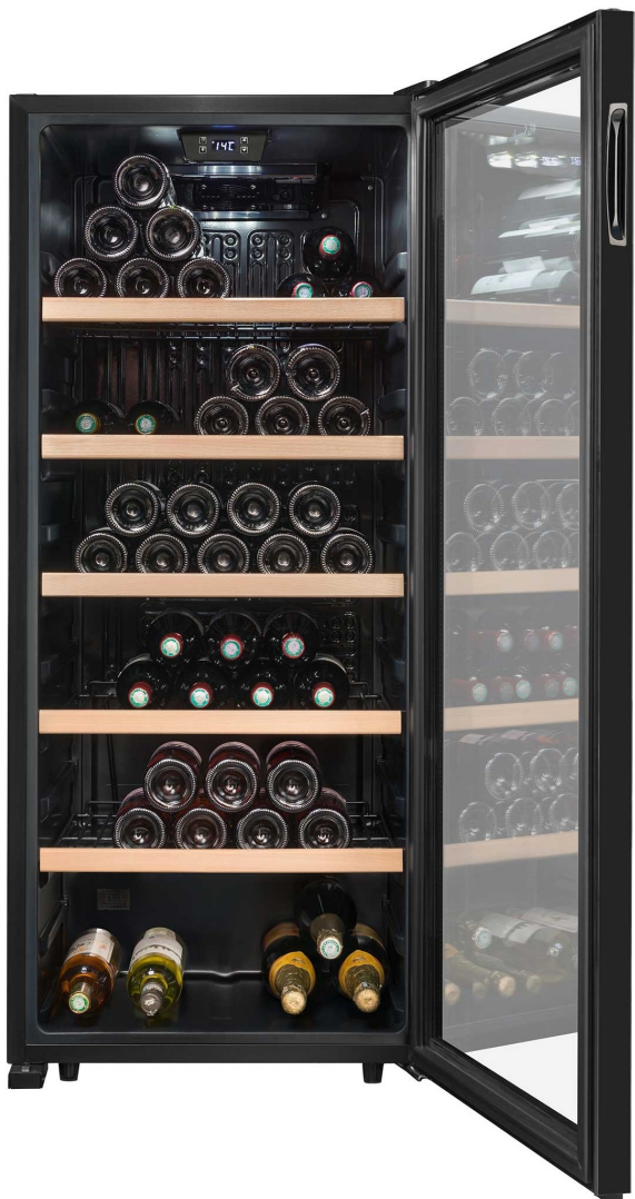
Capacité de 121 bouteilles type Bordeaux 75cl avec 3 clayettes Capacité de 105 bouteilles type Bordeaux 75cl avec 5 clayettes