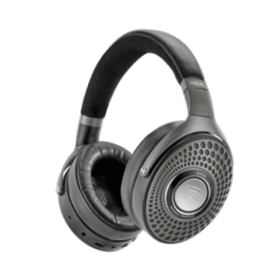
Black & Silver