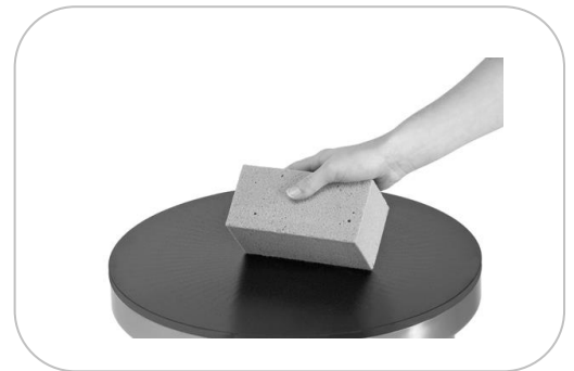
Pierre abrasive Abrasive stone APA1