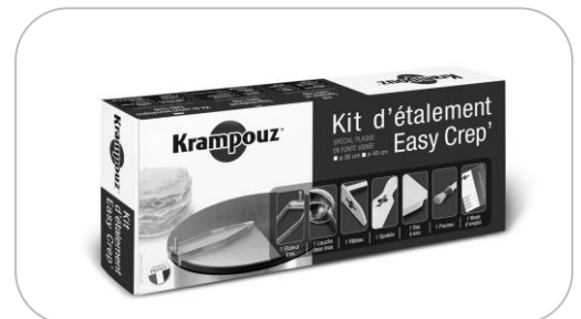
Kit d'étalement Spreader kit AKE84