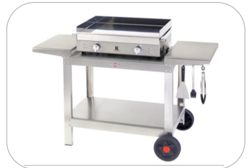
Chariot PLEIN AIR / Cart PLEIN AIR