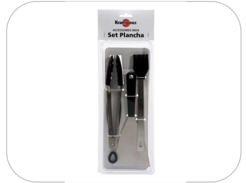
Set accessoires Plancha / Set accessories for plancha