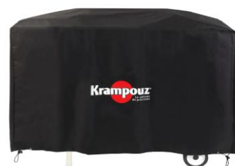
Housse pour Chariot Plein Air (Ref. AHC1)**

* La plancha est vendue séparément. ** Le chariot PLEIN AIR est vendu séparément.