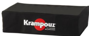
Cover for double K plancha (Ref. AH3)