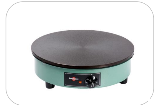
Crêpière BILLIG/ Electric crepe maker BILLIG