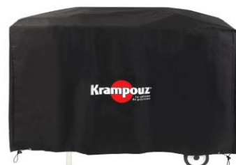
Funda para el carro Plein Air (Ref. AHC1)**

* La plancha se vende por separado. ** El carro PLEIN AIR se vende por separado.