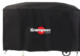
Cover for Plein Air Cart (Ref. AHC1)**