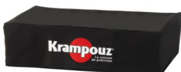
Funda para la plancha K doble (Ref. AH3)