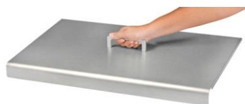
Cubierta para la plancha K doble (Ref. ACP5)