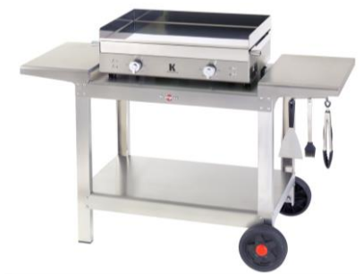
Carro plein air para la plancha K doble (ref. KHEA05)*