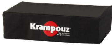
Schutzabdeckung für Plancha-Grill K double (Bez. FH3)

Deckel für Plancha-Grill K double (Bez. ACP5)