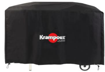
Schutzabdeckung für Wagen PLEIN AIR (Bez. AHC1)**

* Der Plancha-Grill wird getrennt verkauft. ** Der Wagen PLEIN AIR wird getrennt verkauft